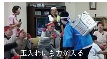
玉入れにも力が入る