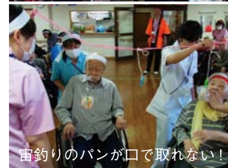
宙釣りのパンが口で取れない!

10月19日にミニ運動会を開催致しました。入居者様が赤組、白組に分かれ準備体操の後に競技に入り『玉入れ競技』、『風船バレー』、職員による『ぐるぐるミイラ』そして白熱した『パン食い競争』と入居者様が終始、勝負あり、笑いあいの楽しい運動会となりました。