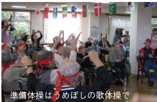
準備体操はうめぼしの歌体操で